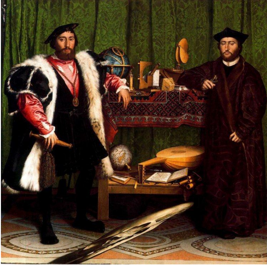
Holbein. Los embajadores, 1533.

Los embajadores, está pintado con gran habilidad para crear en el espectador la ilusión de que mira objetos y muestra materiales reales. De alguna forma para “los embajadores” como para el pintor era importante que sus pertenencias fueran representadas de tal manera que se “sintieran”, donde se presenta la importancia y el añoro como una identidad, un nivel social y los conocimientos que tenían acerca de la música, el mundo como el querer que estos quedaran pintados en un cuadro para el reconocimiento de ellos y la existencia de una información sobre su posición en el mundo.