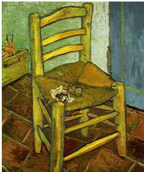
Autor: Van Gogh, la silla, pintura

Justamente, una de las intenciones que nos animan es exponer la posibilidad de una ontología neutral, en la que el objeto pueda hablar con voz propia (como en la pintura de Scholtz o en los grabados del estilo neutro), sin necesidad de reflejar que “el hombre es la medida de todas las cosas”, ni las cargas emotivas que el ser humano puede proyectar sobre las cosas, desarraigándolas de sí para reducirlas a la condición de pantalla (silla, de Van Gogh). (Baudrillard, 2007: 42)