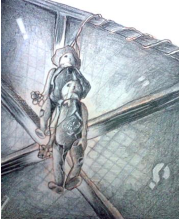
Autor. Taide Martínez, st, dibujo, 2012

Es como ver un reloj de pared, de esos relojes viejos que aun tocan las campanadas para dar la hora y entonces tu identificas ¡¡ah sí; el reloj de la tía!!, y que por cierto me gusta cada que voy de visita a su casa es lo primero que veo y quisiera llevármelo a mi casa.