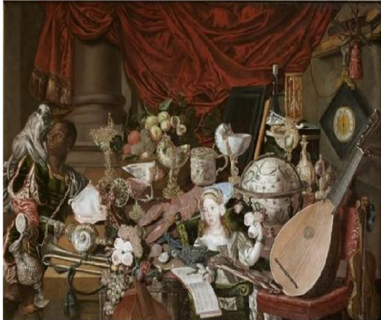
Los tesoros de Paston

De nuevo en esta pintura renacentista se muestra la posesión de objetos que muestran un pasado y que simbolizan ideas siendo que esta obra pictórica está llena de cosas que se atesoraron y se habla de las posesiones que tenían los burgueses y sus inmensas fortunas.