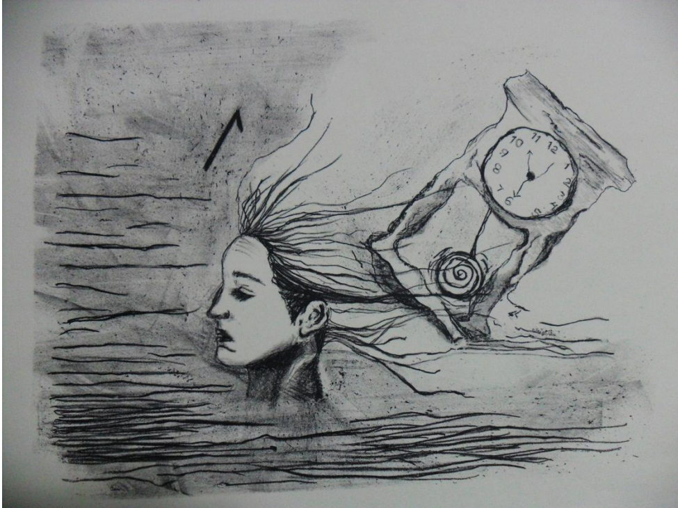
Autor: Taide Martínez. El dolor del tiempo. 35 x 28 cm, 2012

Es claro como la gente comienza a darle un valor o significado importante de afección a un objeto desde su creación, como se lee en las líneas anteriores que hablan sobre el reloj, ese valor no solo será para el conjunto de personas que crearon el reloj, sino también para aquellas personas que lo adquieren y deciden quedárselo o darlo como un presente