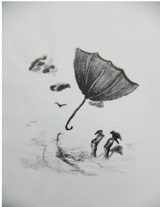
Autor: Taide Martínez. Después del viento, litografía, 2009

“la expresión que utiliza cuanto quiere definir los efectos de la imaginación inspirada es (...) “terror divino”, una expresión que, indudablemente, nos parece poco adecuada para definir nuestras reacciones de espectadores benévolos, pero en cambio, a partir de un cierto momento se encuentra cada vez más a menudo en las notas en las que los artistas modernos intentan fijar su experiencia del arte”. (Agamben, 2005:16)