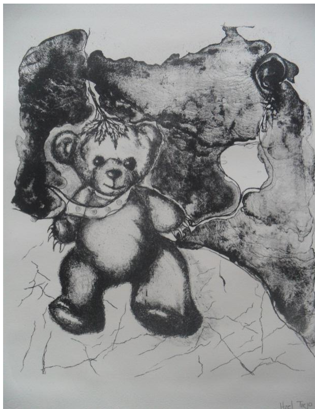
Autor: Taide Martínez, Mi oso, litografía, 38 x 56 cm, 2012

Si para conocerme tengo que convertirme en objeto, imprescindible es el otro, por eso necesito un espacio del arte que pase por el otro y así reflejarme o comprender un tiempo que transcurre a mi alrededor. Siendo que el arte de el grabado permite hacer incisiones e impactar sentidos, entonces comienza una interacción entre el artista, el espacio y el tiempo en el que está inmerso.