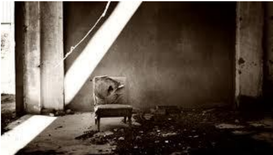
Thomas correa, fotografía.

han convertido en objetos de desecho o bien en inmundas localizaciones”, por lo que observados a través del objetivo de Thomas Correa se transforman en hermosas postales donde queda reflejado el transcurso del tiempo y el valor de la historia que los envuelve. Sus fotografías son más de lugares urbanos que de objetos pero aun así muestra cómo la sociedad se va olvidando y dejando cosas para obtener otras.