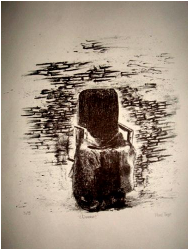
Autor: Taide Martínez, ¿Dueño?, litografía, 38 x 56 cm, 2010

... y no solo experiencias personales, sino también la experiencia histórica esencial de nuestra relación con el pasado: es decir, la experiencia de buscarle un significado a nuestras vidas, de intentar comprender una historia de la que podemos convertirnos en agentes activos. (Berger, 2001: 41)